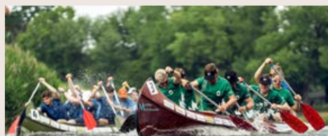
Rund 32 Mannschaften duellieren sich bei heiß umkämpften 150m-Sprints im Elsterflutbett