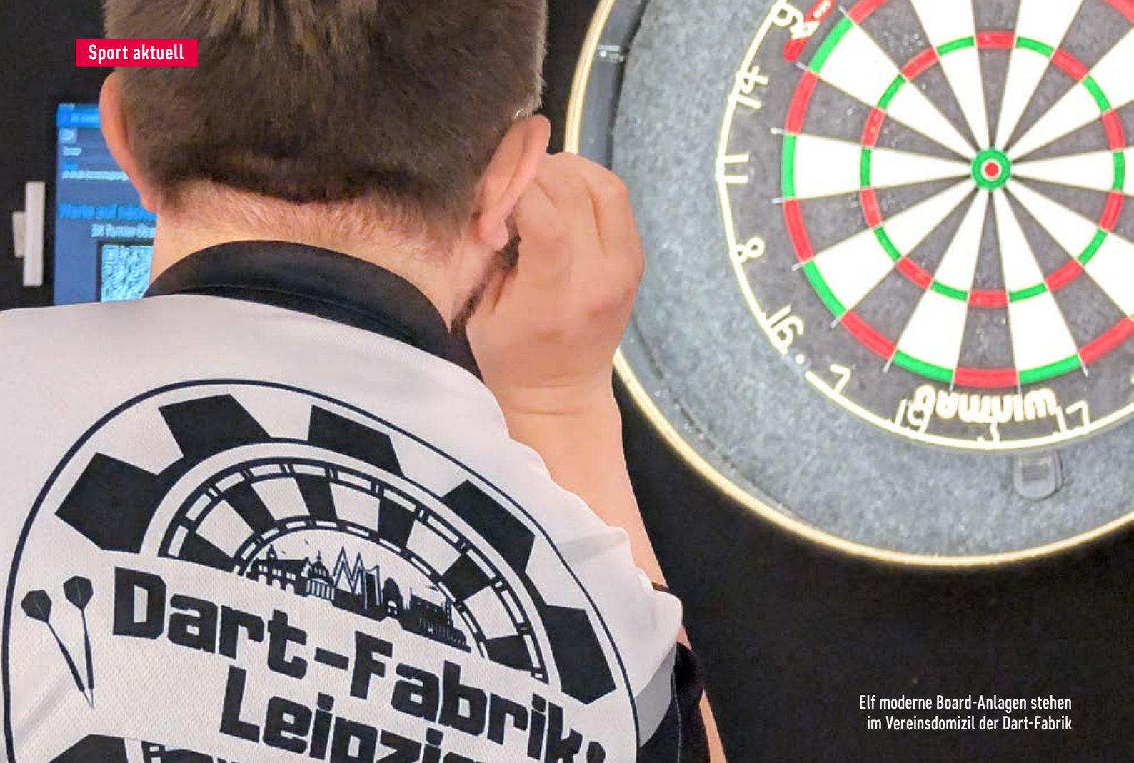
Elf moderne Board-Anlagen stehen im Vereinsdomizil der Dart-Fabrik