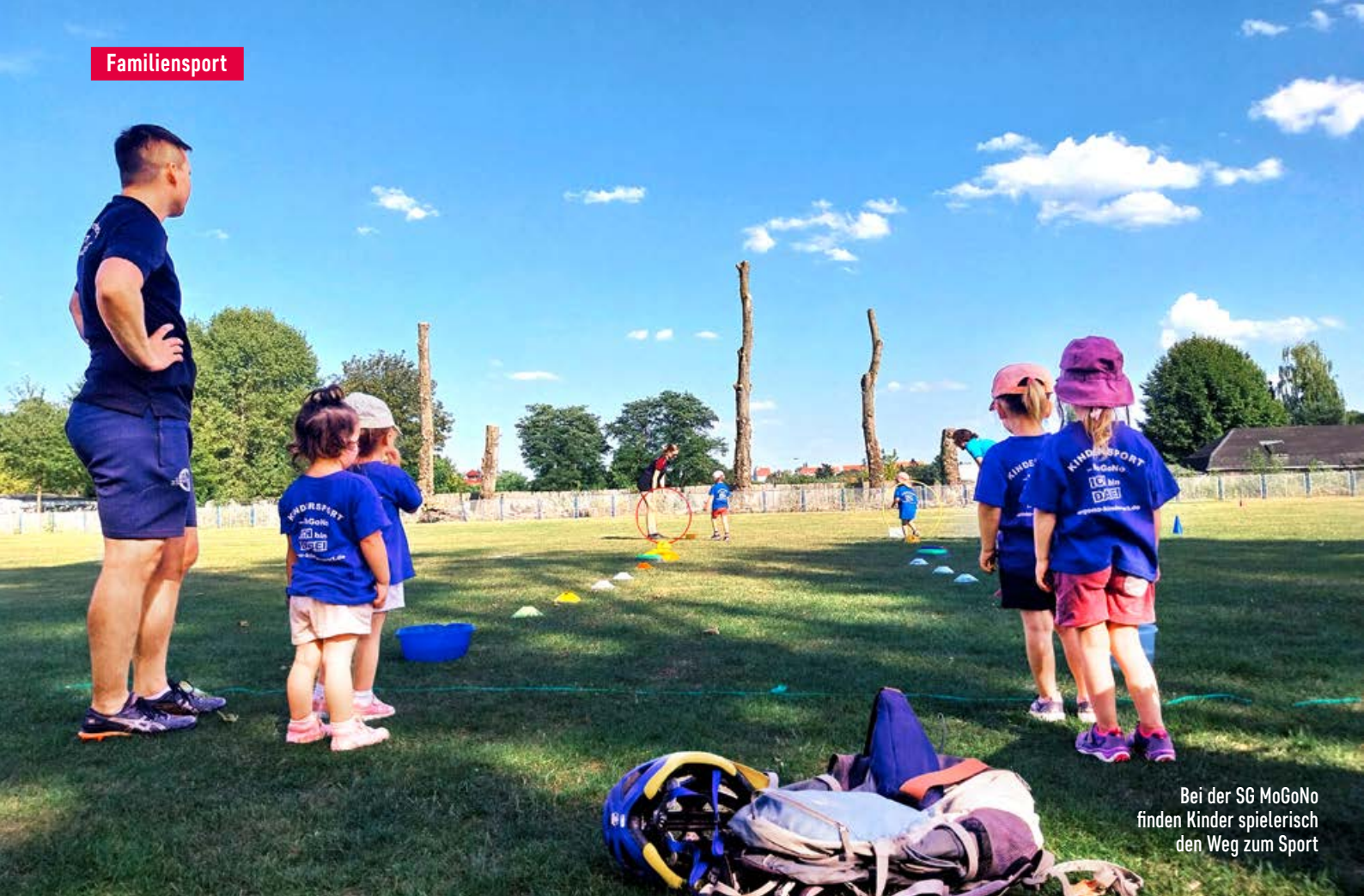
Bei der SG MoGoNo finden Kinder spielerisch den Weg zum Sport