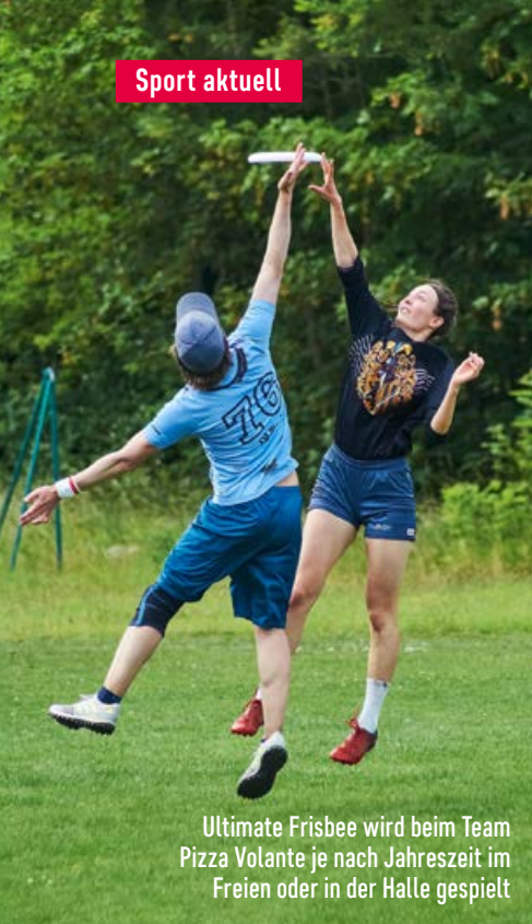
Ultimate Frisbee wird beim Team Pizza Volante je nach Jahreszeit im Freien oder in der Halle gespielt