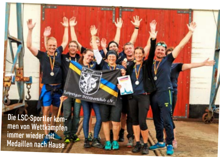
Die LSC-Sportler kommen von Wettkämpfen immer wieder mit Medaillen nach Hause