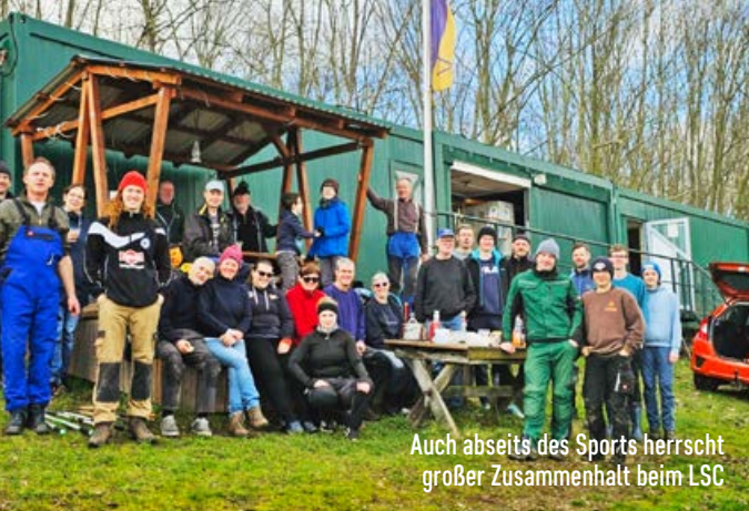
Auch abseits des Sports herrscht großer Zusammenhalt beim LSC