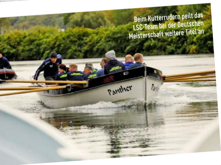
Beim Kutterrudern peilt das LSC-Team bei der Deutschen Meisterschaft weitere Titel an