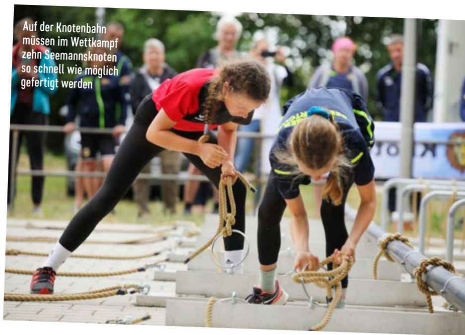
Auf der Knotenbahn müssen im Wettkampf zehn Seemannsknoten so schnell wie möglich gefertigt werden