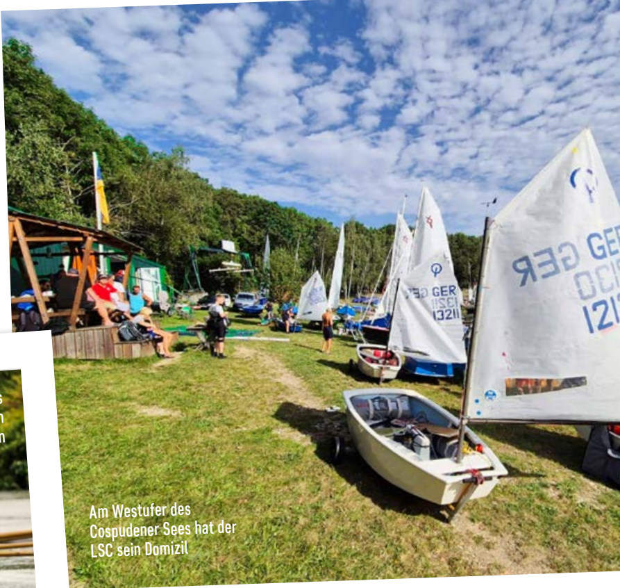
Am Westufer des Cospudener Sees hat der LSC sein Domizil

Der Leipziger Seesportclub e. V. (LSC) wurde im Mai 1990 mit 48 Mitgliedern gegründet. Die Wurzeln gehen jedoch bis in die 1950er Jahre zurück. Heute gehören dem LSC gut 85 Vereinsmitglieder im Alter von sieben bis 71 Jahren an. Auf dem Vereinsgelände am ehemaligen Elsterstausee sowie auf dem Hafengelände am Cospudener See steht der Seesport im Mittelpunkt aller Aktivitäten.